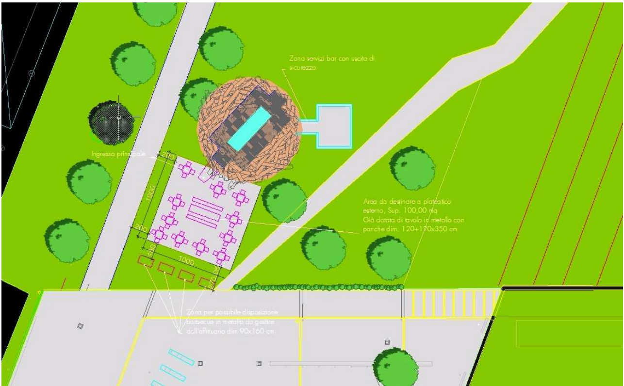
Planimetria con individuazione plateatico.